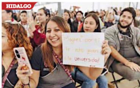
■ En Tulancingo, el candidato presidencial de MC fue recibido por alumnos de la Universidad Vizcaya de las Américas.