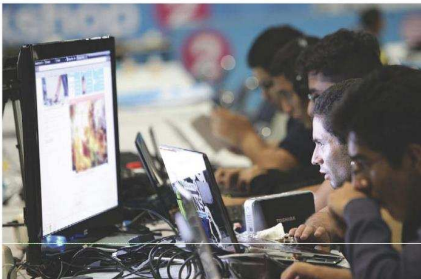
Informaron que tomaron las precauciones posibles para blindar la parte técnica.

El PREP, diseñado por personal capacitado del instituto electoral, ha sido usado en diferentes procesos, donde se mejoró en cada uno de ellos, así como con los tres simulacros que llevaron a cabo para probar su eficacia y someterlo a estrés por consultas masivas, ataques de vulneración, entre otros factores que pudieran afectar su desempeño.