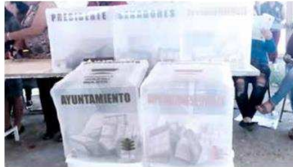
Desde hoy, empieza el periodo de reflexión para los votantes.

En esta contienda electoral, se elegirán un total de 3 mil 067 cargos a nivel nacional, incluyendo, Presidente de la República, 128 senadores, 500 diputados federales, 30 gobernadores y Jefes de Gobierno, mil 900 diputados locales, así como 508 presidentes municipales y alcaldías.