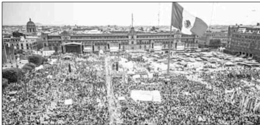
◀ En un emotivo discurso, Claudia Sheinbaum ofreció fomentar un México plural, diverso y democrático.

"Tengo claro que mi obligación es llevar a México por el sendero de la paz, la seguridad, la democracia, las libertades, la justicia con la Cuarta Transformación de la vida pública. Tengo claro que nuestras guías son el bienestar y la felicidad del pueblo. Tengo claro mi responsabilidad como la próxima presidenta de México."