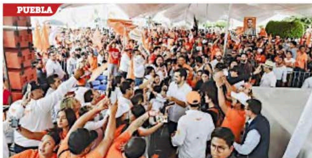
■ El emecista cerró campaña en un mitin en San Martín Texmelucan, en donde llamó a votar el próximo domingo.