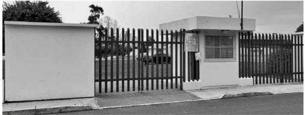
El PJEM señaló que además de los juzgados, también estarán en funciones las áreas administrativas clave del Poder Judicial.

“El Consejo de la Judicatura fundamentó esta decisión en diversos artículos de la Constitución Política del Estado Libre y Soberano de México y la Ley Orgánica del Poder Judicial, asegurando que se atiendan las