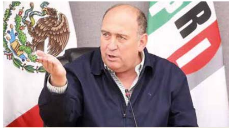
VIGILANCIA. Rubén Moreira, líder del PRI en San Lázaro, ayer.