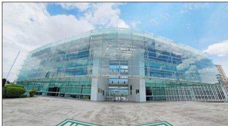
▲ El Instituto Electoral mexiquense ha dejado a un lado la discusión política, dice el analista.