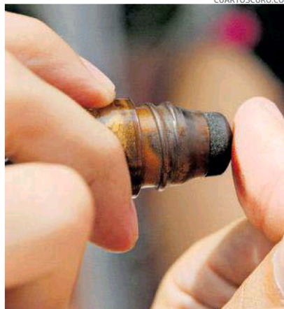
Los funcionarios de casilla pondrán la tinta indeleble a quienes acudan a este ejercicio democrático

Ante los hechos violentos que han manchado los preparativos y campañas