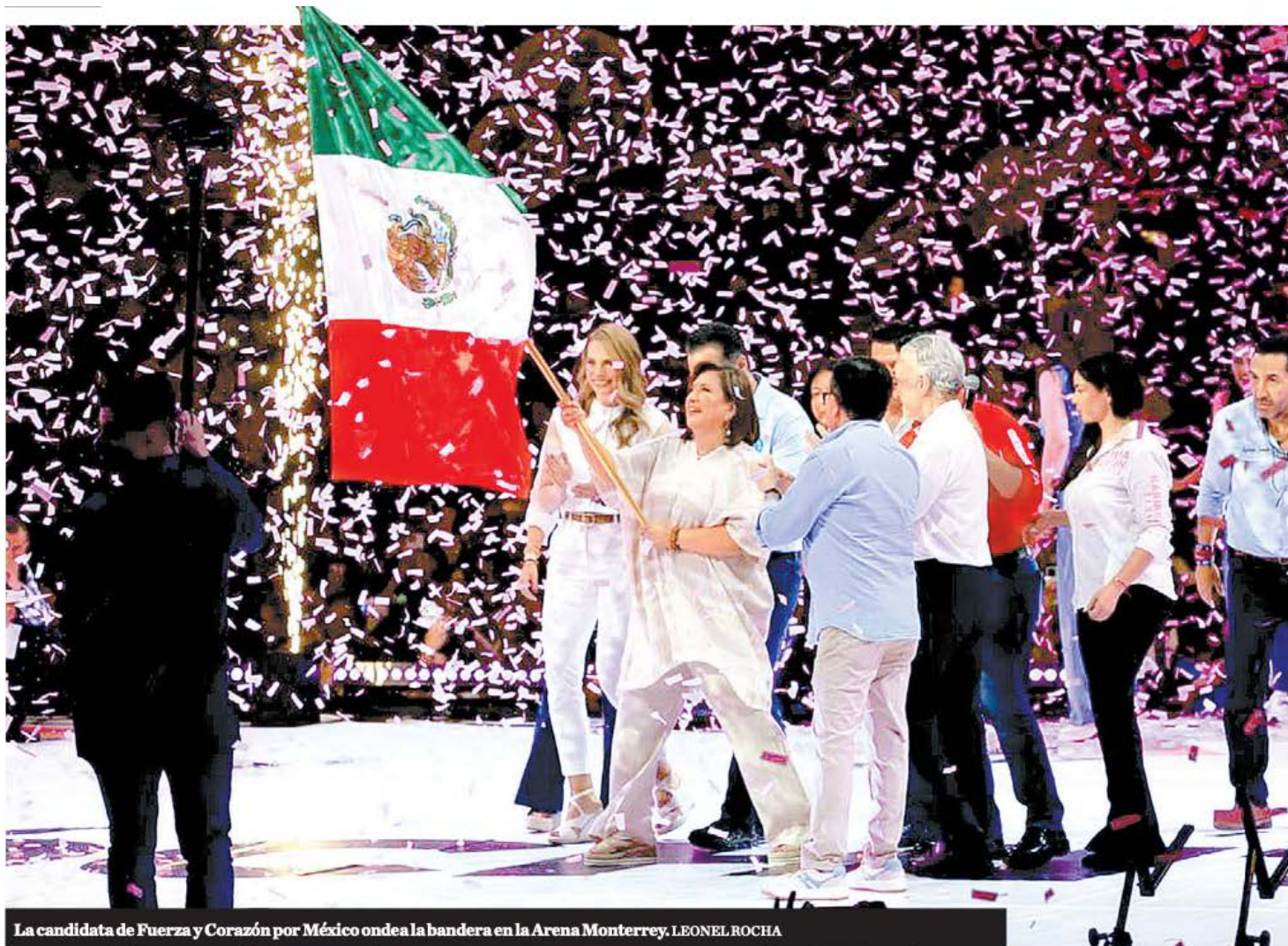
La candidata de Fuerza y Corazón por México ondea la bandera en la Arena Monterrey. LEONEL ROCHA